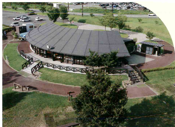
▲各コースを一望できる交流館 (食堂・シャワー・自動販売機など備えています)