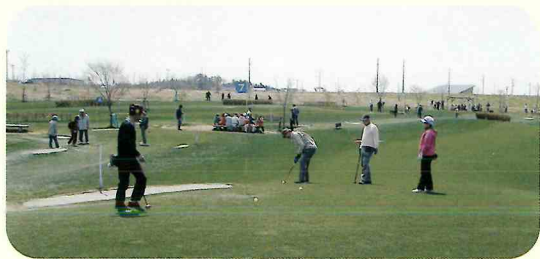
▲「あじさいコース」でのプレー状況