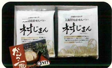
▲大衡村産ひとめぼれを生地にし、村の頑固なせんべい職人がじっくりと焼き、三種のだしを入れた県産大豆の醤油につけて、みちのく寒流のりで包んだ、大衡村特産せんべいです。