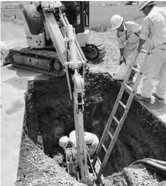
水道管漏水修繕工事

答 私債権管理条例に基づき事業休止の法人3社で97千円、行方不明4名の58千円、相続放棄4名の637千円で計792千円を処分した。