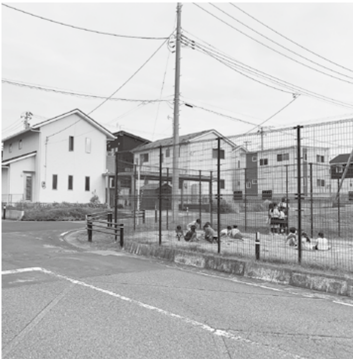
移住定住の増加を（ときわ台南住宅団地）

村長 本村のふるさと納税は伸びていない。魅力ある返礼品や充当事業を示し、ふるさと納税の方策を進めていきたい。