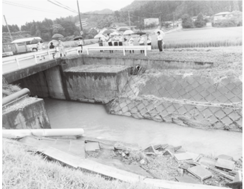
駒場川の被害状況