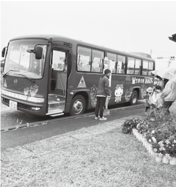
安全に保護者のもとへ

答 外構工事で駐車場は確保される。センターと中学校への通路に出入り口を設ける予定である。