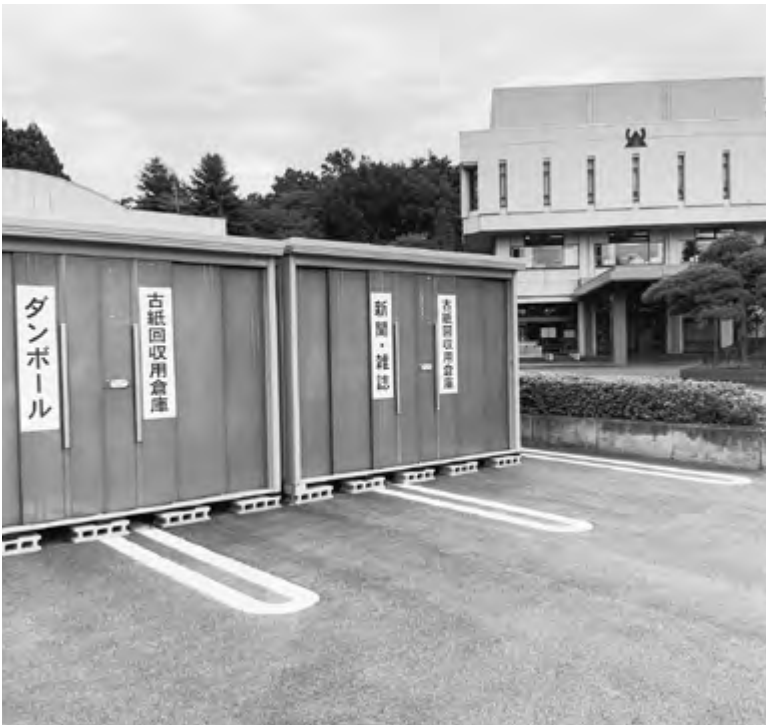
役場駐車場内の古紙回収倉庫

答 確認しておらず指摘のとおりである。早速正しい保険料に更新し、今後そのようなことがないように注意していく。