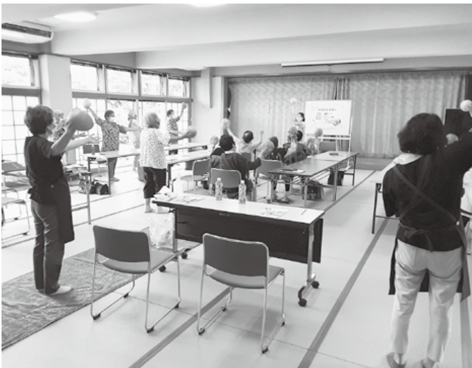
人生100年時代を健やかに！

答 新型コロナウイルスの流行や専従する保健師の確保が難しいこと等から実施できなかった。 保健、介護事業で、保健師の兼務も認められたため人的体制を強化し、令和6年度からの実施に向けて準備を進めている。