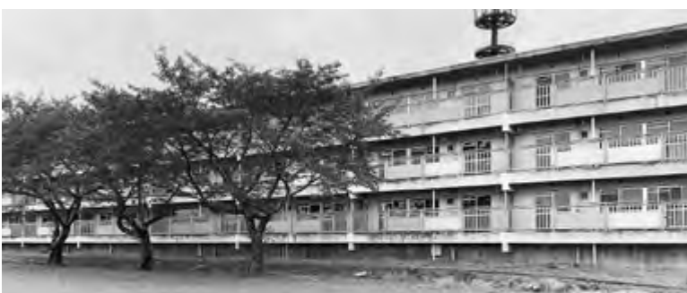
撤去予定の五反田北住宅1号棟