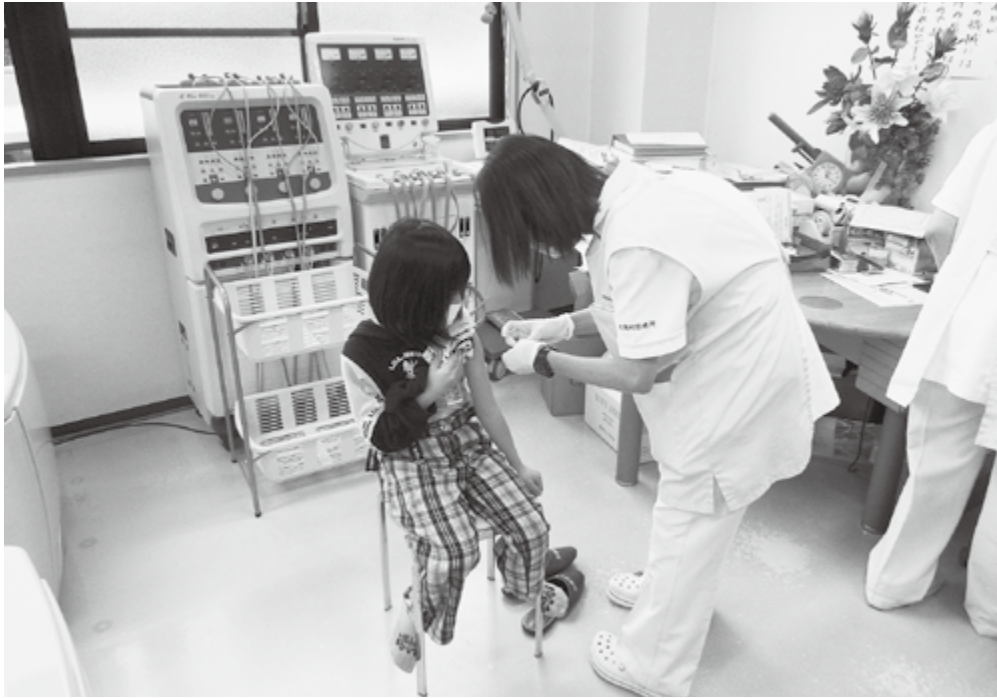
ワクチン小児接種

令和4年第3回定例会は、9月6日から16日までの11日間にわたり開かれた。村長提出案件は、同意1件、条例改正1件、辺地計画の変更1件、請負契約1件、令和4年度補正予算7件、報告2件、令和3年度各種会計決算認定7件の全20議案が提出され、全て原案どおり可決された。