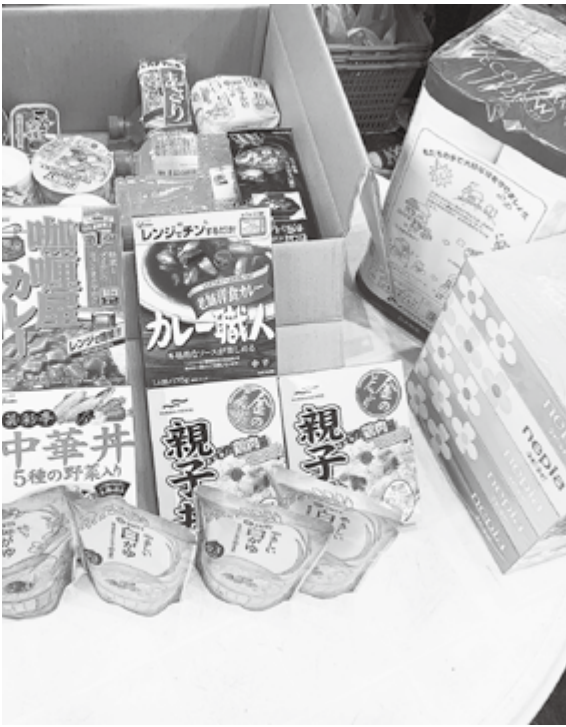
村からの支援物資

答 本年9月受付まで126セットの申し込みがあり支給した。今後もチラシやホームページで広く周知していきたい。