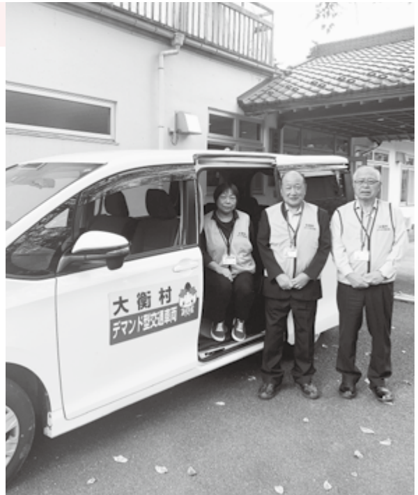
ご利用をお待ちしています