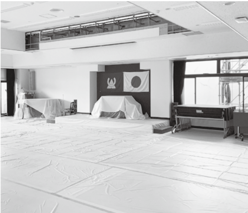
修繕工事中の平林会館