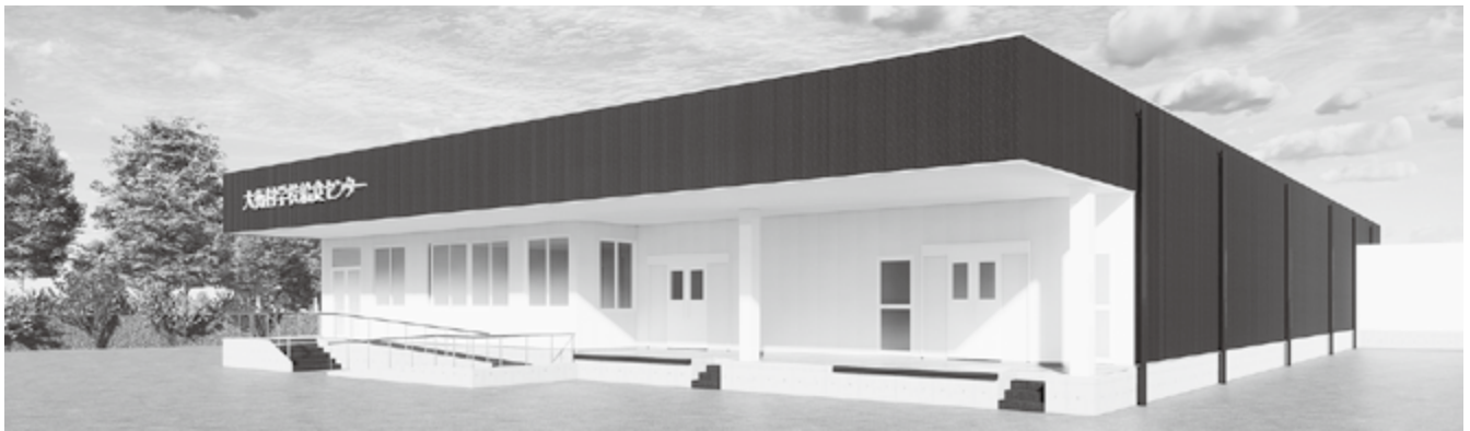
学校給食センターイメージ図

厨房設備は物価高騰による事業費の増額、債務負担行為限度額の変更が必要であるため、予算補正後に備品購入事業として一般競争入札を予定している。