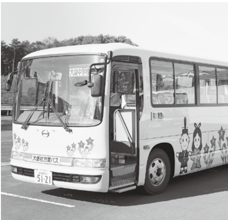
運行の見直しが求められている万葉バス

交通体系 問 住民アンケート等で村民の声を聞き、交通体系を見直しては。移住定住を進めるうえでも買物、医療機関への利便性を考えるべきではないか。 村長 財政や住民の声を聞きながら、万葉バスとデマンド型交通の運行のあり方を総合的に検討していきたい。