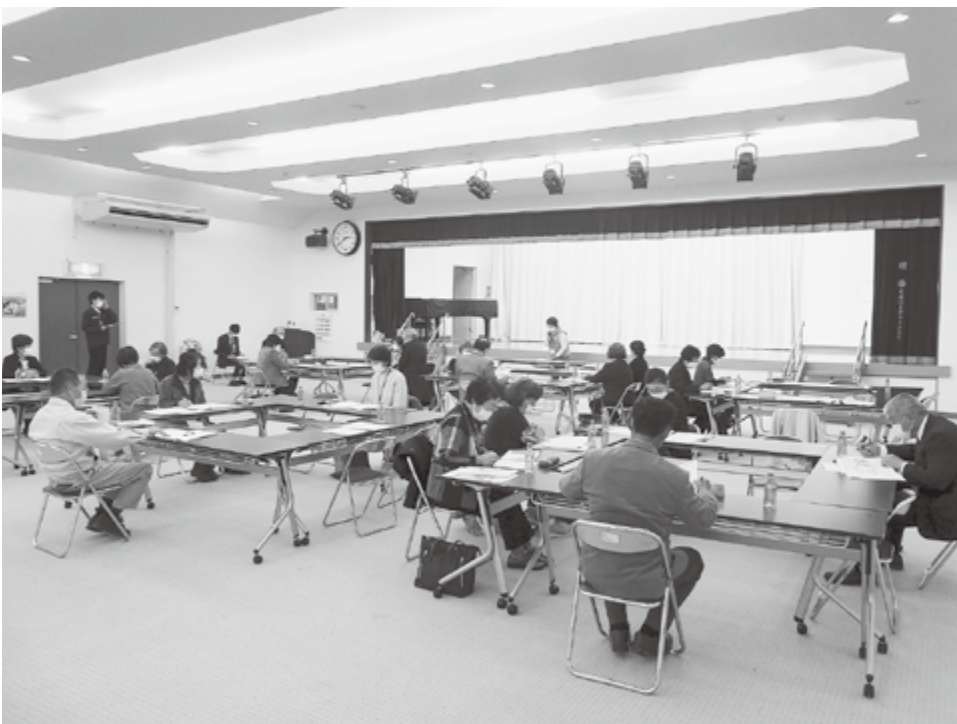
民生委員の移動研修状況