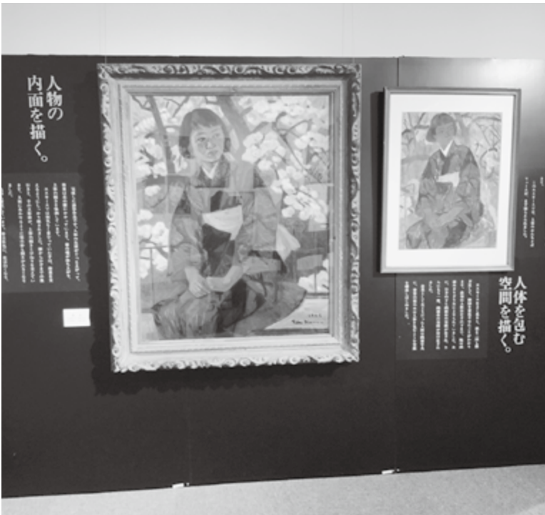
修復された美術館の絵画

答 団員数が減少している中で、団員の年齢制限や分団の再編は検討しなければならぬ課題である。ポンプ車の配備も併せて検討していく。