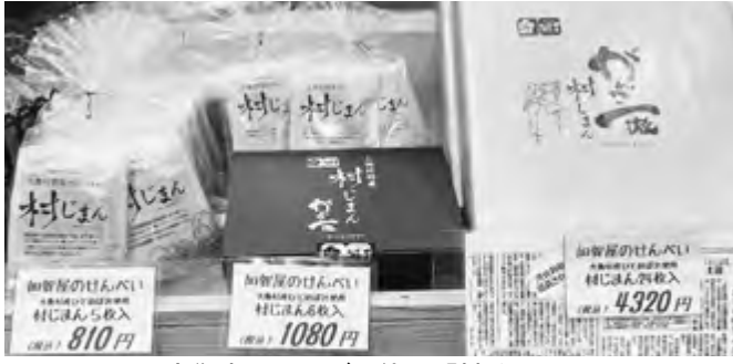
大衡産ひとめぼれ使用「村じまん」