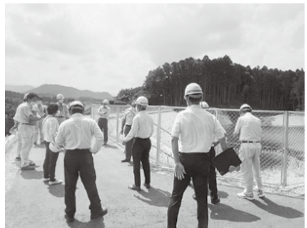
金堰1号ため池現地調査

金堰1号ため池はほぼ完成状況での現地調査で、完成後は住民での管理になるとの説明を受けた。今後の施設管理の課題を検証していく必要がある。障害防止対策については、これからも住民の意見をもとに強く要望していく。