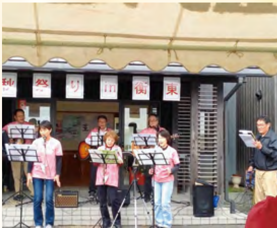
青春真っ盛り?? 名前負けしない「へたっぴーず」のメンバー