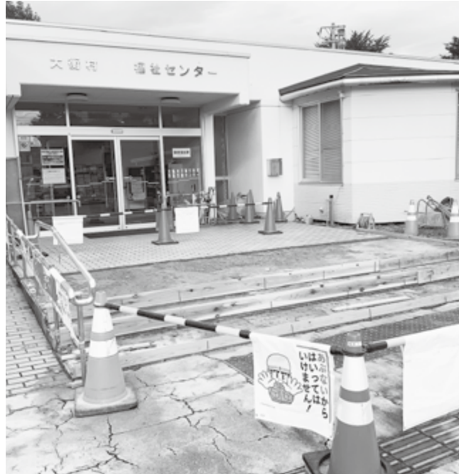
福祉センター入口修繕工事