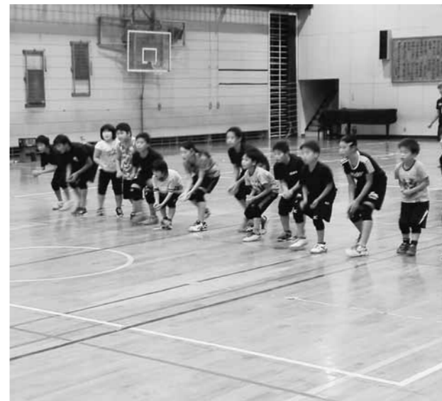
ドッジボールスポーツ少年団活動（小学校体育館）