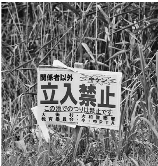
ため池事故防止看板

村長 看板の設置はもとより教育委員会・PTA・大和警察署・村が連携して注意喚起をしていく。