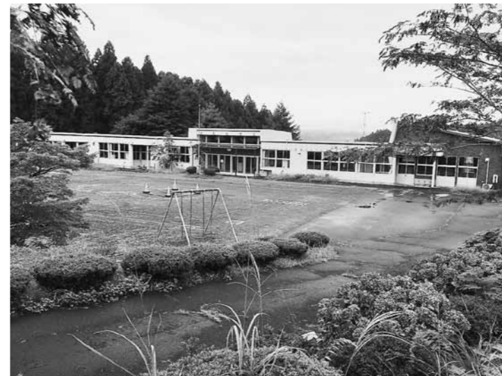
活用が待たれる旧幼稚園舎

村長 村の教育財産にふさわしい活用のあり方を検討すべく、教育長を座長とした検討委員会の立ち上げを準備中である。