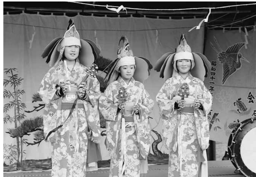
小学生による大瓜神楽

—大瓜神楽保存会への補助金に変更はないのか、 教 27年度までは10万円だったが、音響設備更新等のため28年度は15万円とした。