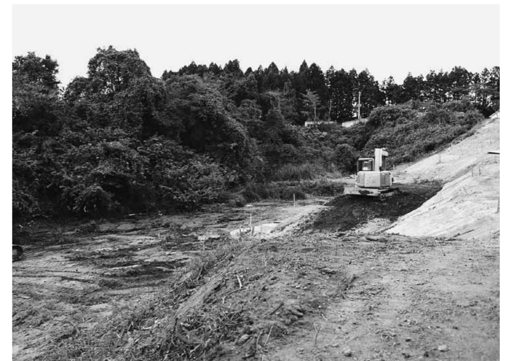
災害復旧中の農地（衡東地区）