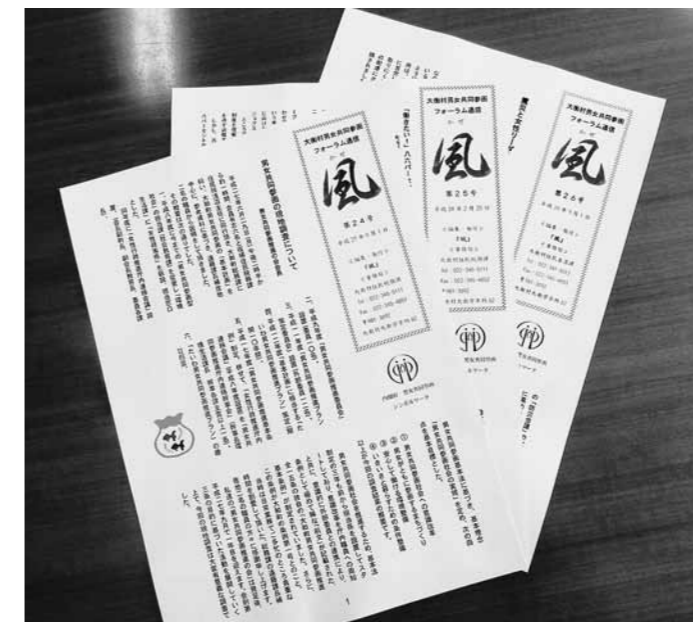
フォーラム通信「風」

村長 大衡村において、男女共同参画の社会というものは、ある程度構築されていると認識している。 今後は条例を制定し体制を整えながら、活動しやすい形にするのが最善であると思っている。