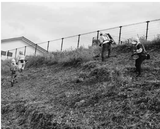
まちづくりセンターによる草刈り

村長 高齢化や後継者不足解消に向け、JAあさひな等と連携し、集落営農組織を進めたい。約1350haが優良農地に指定されているが、本村農業の営農環境を守りながら、今後も適正に対処していく。