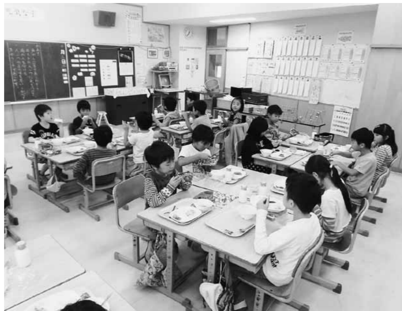
小学校給食のようす