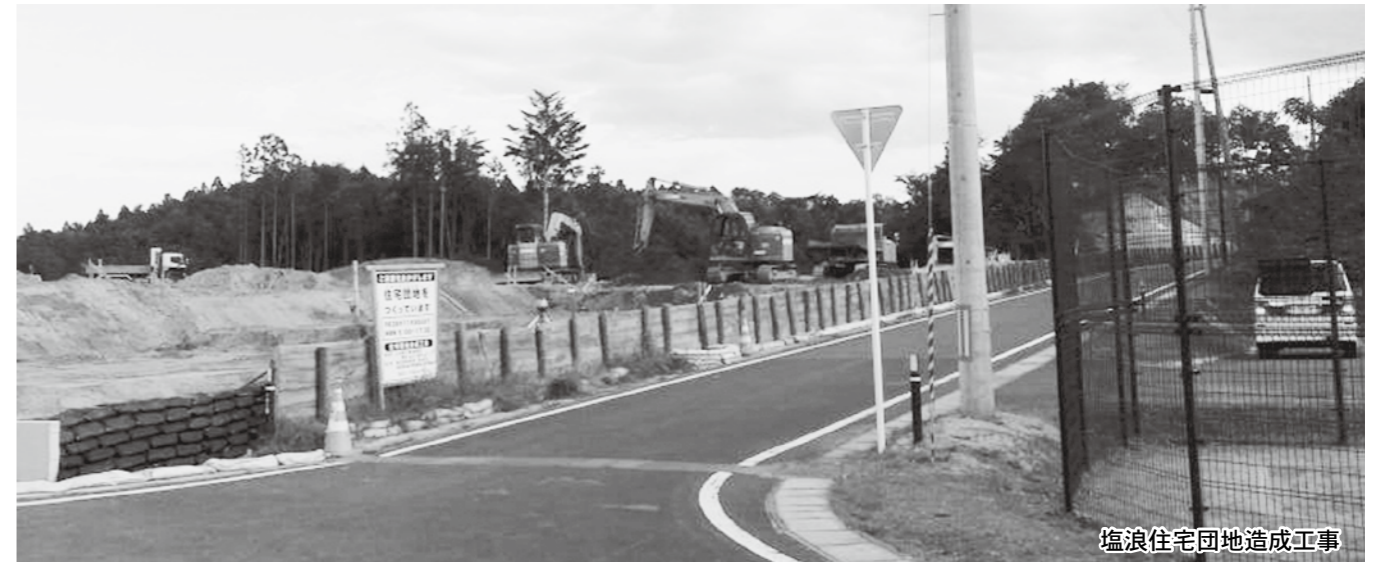
塩浪住宅団地造成工事