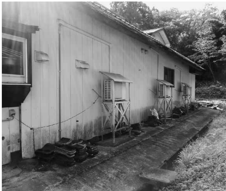
経年劣化が進む空調設備

※裾野市の演習場対策 騒音対策・水源枯渇防止・環境保全関連 調整池設置事業 緑地帯設置委託事業 ・防火帯の整備 ・下刈り ・樹木の間伐 ・植林 これには国だけでなく住民と自治体も参加する。