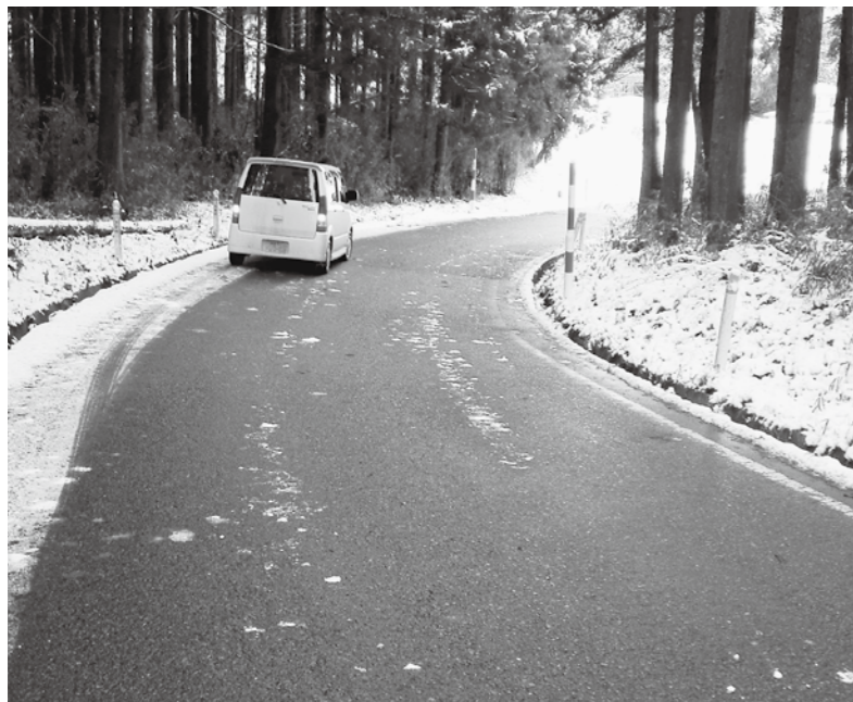
村道新堀薬師堂線

宮城県との河川協議上課題があり、多大な事業費を要することからも、橋の架け替えは難しい状況となっております。