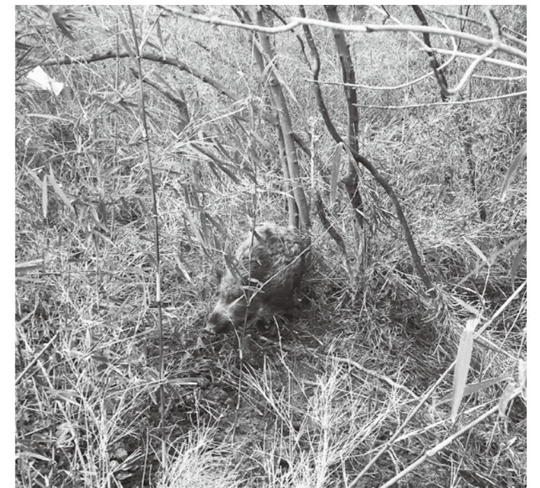
ワナにかかったイノシシ

本村の基幹産業である農業振興のため、農業関係の補助事業の一部を見直しするなど、柔軟に対応できるよう検討していきます。