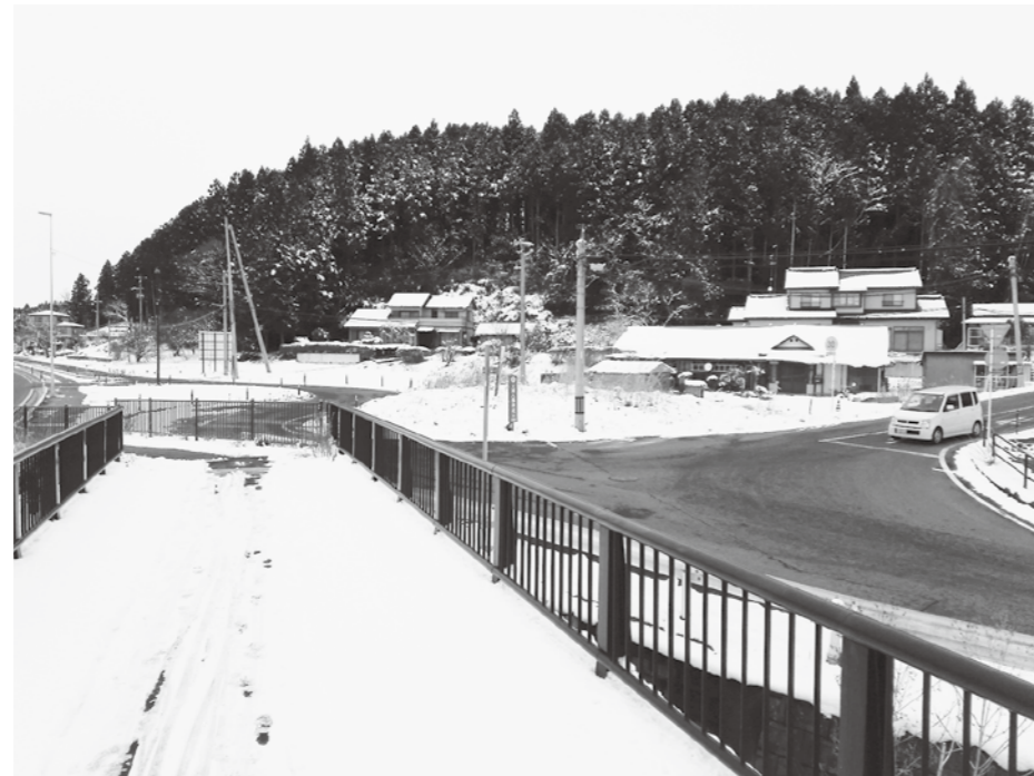
大衡城下変則交差点

要望路線につきましては、年に3〜4基程度の設置により複数年に対応したいと考えております。