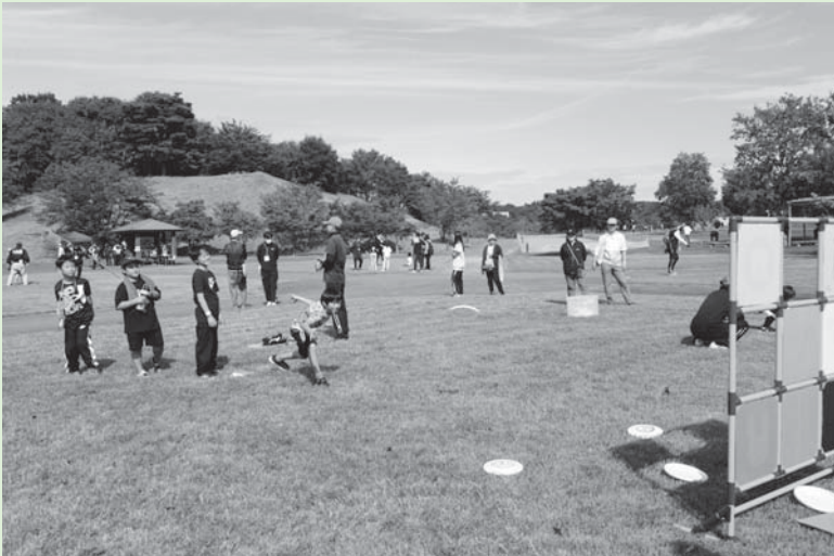
▲的を狙って…“ディスクゲッター”

10月8日(日)、おおひらスポーツ交流大会をタカカツ万葉パークで開催しました。園内及び周辺の道路を歩く2.8kmコースと走る5kmコースの参加者は、秋晴れの中、気持ちの良い汗を流していました。また、スポーツ体験コースではモルック、ディスクゲッター、ターゲット・バードゴルフ、玉入れの4種目を体験し、スポーツの秋を楽しんでいました。