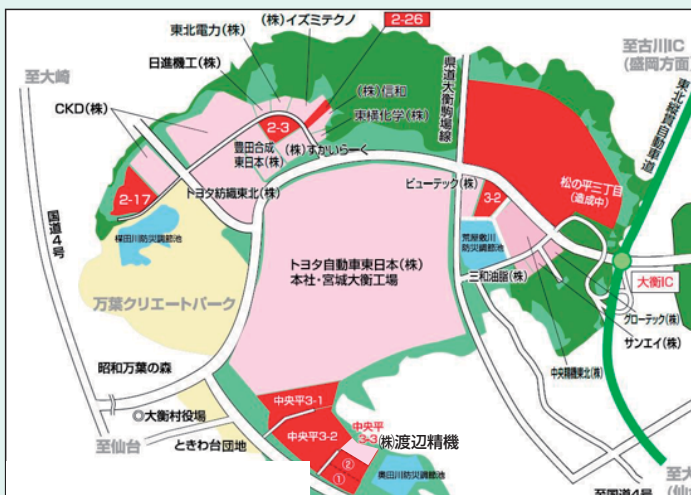
第二仙台北部中核工業団地

国道4号や高速道路のインターチェンジが近いことから、物流面での魅力が高く、また生産関連インフラ（工業用水・電気・ガス等）が完備されており、宮城県が重点分野と位置付けている「自動車関連産業」、「高度電子機械産業」などの集積が現在も進んでいます。