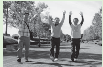
▲ごみを拾いながらウォーキング!