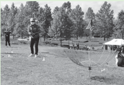
▲ターゲット・バードゴルフ

10月8日(日)、おおひらスポーツ交流大会をタカカツ万葉パークで開催しました。園内及び周辺の道路を歩く2.8kmコースと走る5kmコースの参加者は、秋晴れの中、気持ちの良い汗を流していました。また、スポーツ体験コースではモルック、ディスクゲッター、ターゲット・バードゴルフ、玉入れの4種目を体験し、スポーツの秋を楽しんでいました。