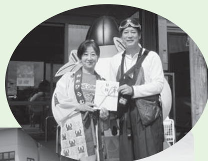
▲俳優の唐沢寿明さん (写真右)