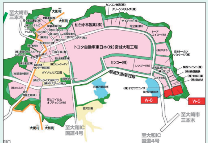
第一仙台北部中核工業団地