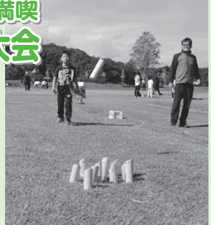
▲フィンランド発祥のスポーツ“モルック”