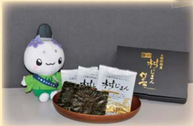
加工品等の販売も！