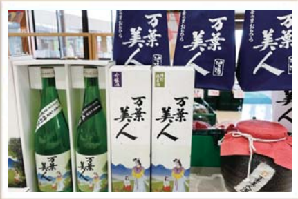
村の特産品を販売中！