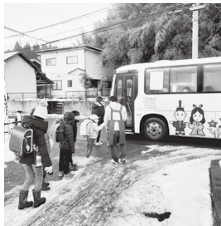
安全のため保護者が付き添う中沢停留所