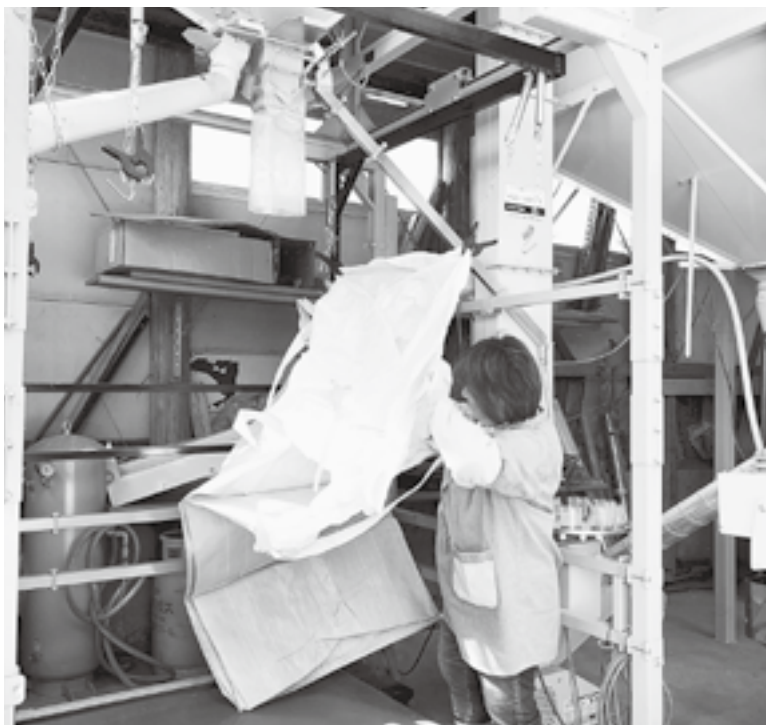
真心こめた米、来年にも繋げたい