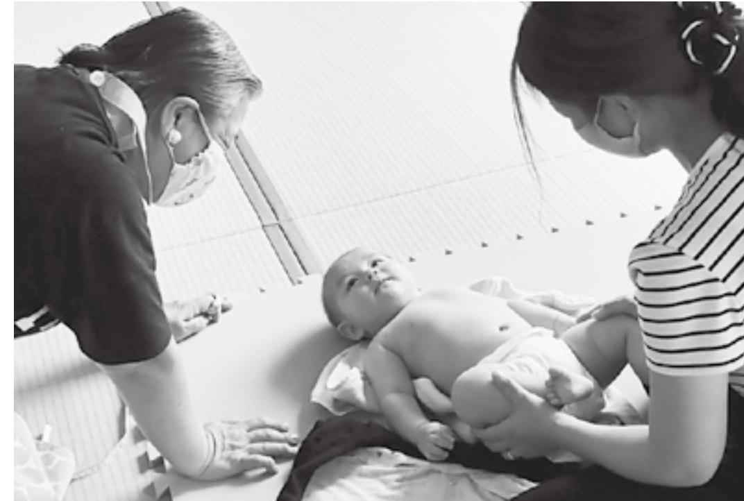
赤ちゃんにも給付金が支給

◎ 子育て世帯支援給付金 給付金の支給に向けてのスケジュールは、 児童手当の受給世帯は申請不要で、年内中に振り込み予定。新生児や高校生、公務員世帯は申請が必要になる。 支給対象者の人数と年齢区分は、 対象者は平成15年4月2日生まれから令和4年3月31日生まれまでの18歳以下の子どもが対象。 児童手当受給者827人、高校生180人、公務員世帯83人、新生児30人の合計1,120人を見込んでいる。 5万円クーポン券ではなく、一括10万円を現金給付にできないか。 国の制度では現金とクーポンそれぞれ5万円という議