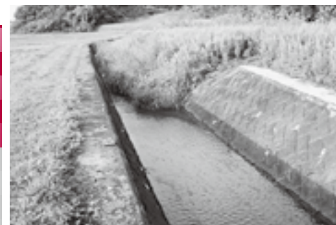
堆積土砂に葦が生い茂った奥田地区荒屋敷川

問 調整池の放流 第二仙台北部工業団地には、洪水調整の大規模防災調整池が3か所設置され、流末は奥田川、荒屋敷川、榎田川に放流されているが現状は。 村長 流出した土砂が所々に堆積し中洲ができ、河川の流れを阻害している。 問 河川愛護作業 3河川を抱える地元の河川愛護作業における声は。 村長 中洲の刈り払いなどでの作業が困難になってきたとの声が出ている。 7月26日に県と合同で現地調査を行った。 問 県の取り組み 一級河川として管理する宮城県での取り組みは。 村長 県は今年度から5か年計画で、工業団地防災調整池の吐口付近と松原地区焼切川に堆積した土砂の撤去を実施する。