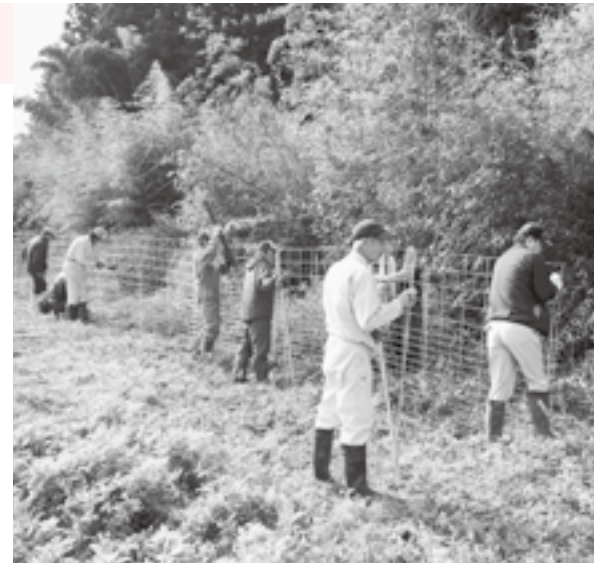
住民の手でイノシシの足止めを