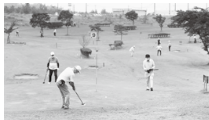
当分の間は700円でプレー

問 パークゴルフ場の利用料金値上げによる料金収入の見込みは。 答 年間600万円の増額を見込んでいます。 問 指定管理者の万葉まちづくりセンターでは、100円だけの値上げを予定している理由は。 答 指定管理者の自主事業である年間バスポートも値上げが想定されるが、今後協議していきたい。