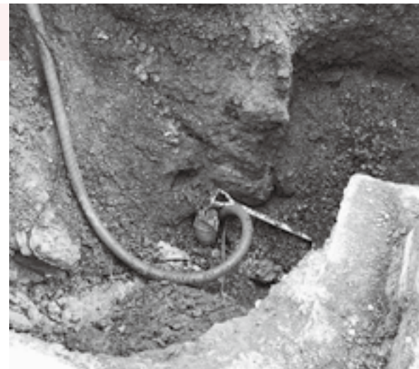
漏水調査で発見し修繕

漏水調査修繕の結果、有収率が前年度73.3%から約6ポイント改善。 今後も漏水調査の継続と配水設備の更新を計画的に進められたい。