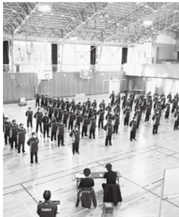
女性団員の整列も見られるのか

問 消防団員数が少なくなっていると言われていたが、全国的に女性消防団の数は増加している。 次年度から消防団員の待遇が変わるので、女性消防組織を設置し、団員確保と共に女性の活動を求められ るのではないかと。