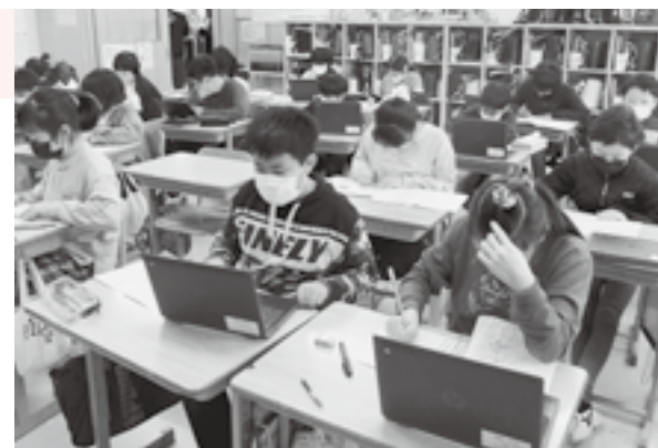
授業風景が変わったよ

タブレット端末は各科目の授業において使用されており、授業の進め方や児童生徒の理解力の向上につながると感じた。