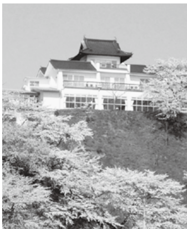
シンボルはどうなっていく...

村長 老朽化は激しく、大規模改修はしないという教育委員会の判断を尊重し、シンボルとして外観・景観を保持していく。