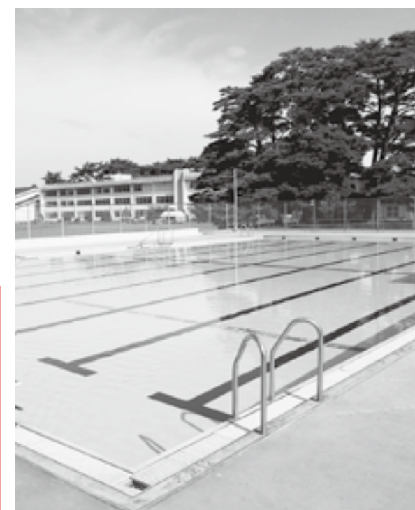
今後の管理はどうする（村民プール）

村長 体育施設全体では指定管理料が2倍になるが、施設管理に従事している社会教育課職員2名の人件費の35%分324万円が節約できると試算している。