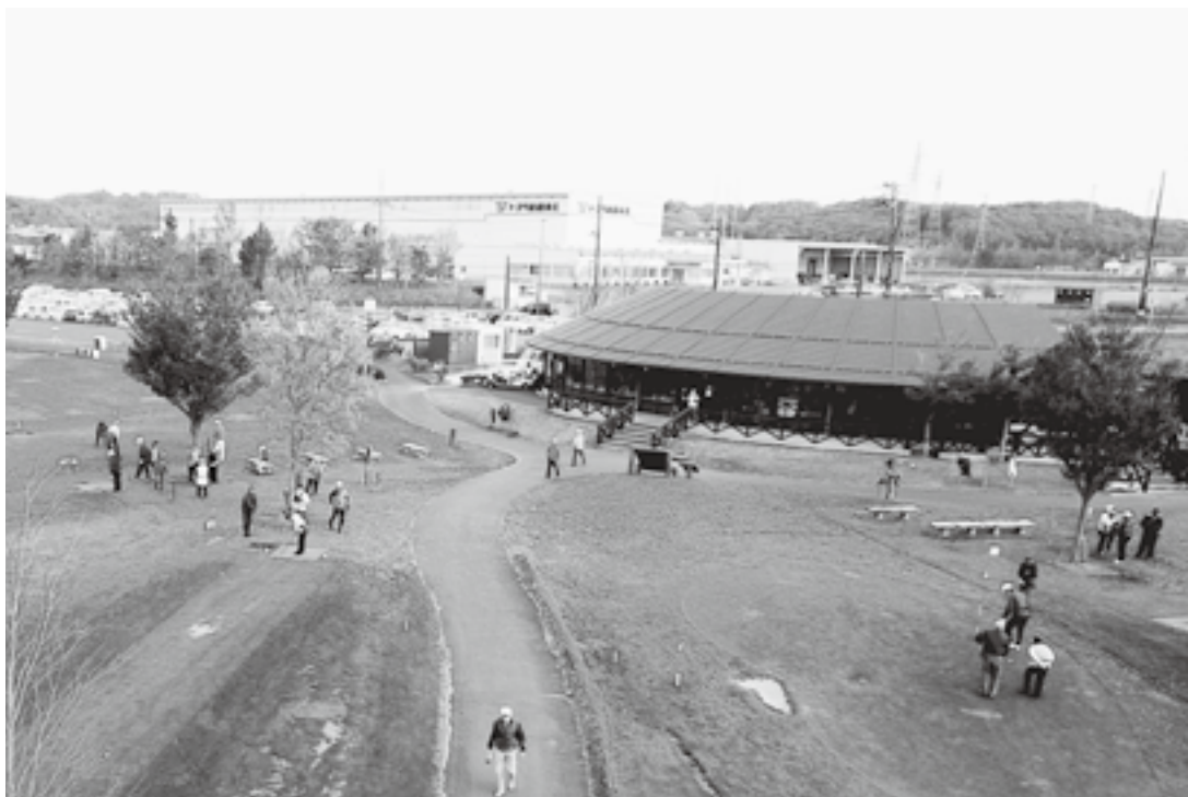
指定管理第1号のパークゴルフ場

答 副村長は申請者である万葉まちづくりセンターの代表取締役であり、審査には一切関わっていない。