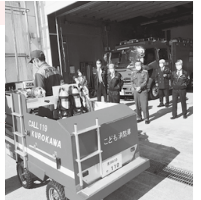
防災の要として万全な体制に

消防車（Pumper）と救急車（Ambulance）が連携して救急活動を行うこと。