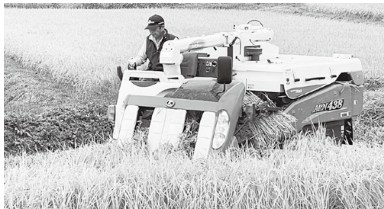
素直に喜べない収穫の秋

問 村には、集落営農団体や、農業機械共同利用組合があるが、多くの農家は個人経営であり、新たな機械更新もままならない。各農家の保有農業機械の橋渡しをする組織を作り、村内の農家をコーディネーターする人材を、村が中心となって構築してはどうか。 村長 大衡版農業公社、あるいは機械のシルバー人材センターのような組織が、構築できれば良い方向に進んでいくと思われる。 問 今後の農業振興のためには、専門の指導員やコーディネーター等の、人材確保が必須である。 村長 農業は大衡村の基幹産業であり、いかに持続させていくかが当面の課題である。地域おこし協力隊や大学なども協定を結んでおり、その方々の意見も参考に真剣に取り組んでいく。