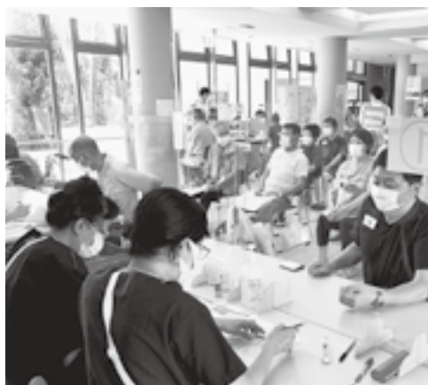
コロナワクチン集団接種(ひだまりの丘)