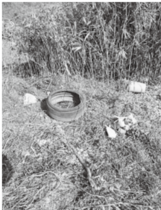
ばい捨ては犯罪です

問 国道にもごみの散乱が見られる。環境美化運動の際、缶酎ハイやビールの空き缶などトラック2台を越す地区もあった。 環境省で調査を行った、ばい捨て禁止条例の有無について村の回答は。