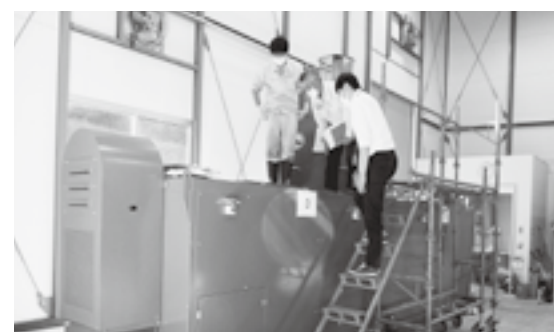
60kg個体8頭を1週間で分解する丸森町の有害鳥獣減容化施設

問 処理施設は広域で 埋設や解体の作業軽減と焼却炉への負荷をなくすため、県南の町で設置するオガクズの常在菌で鳥獣を分解処理する施設の広域整備を本村から発信しては。