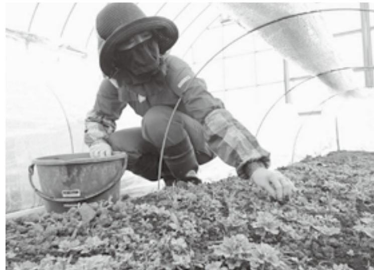
農業女子の活躍に期待