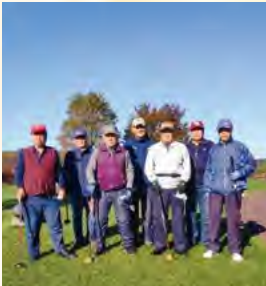
ともに楽しくプレーしましょう