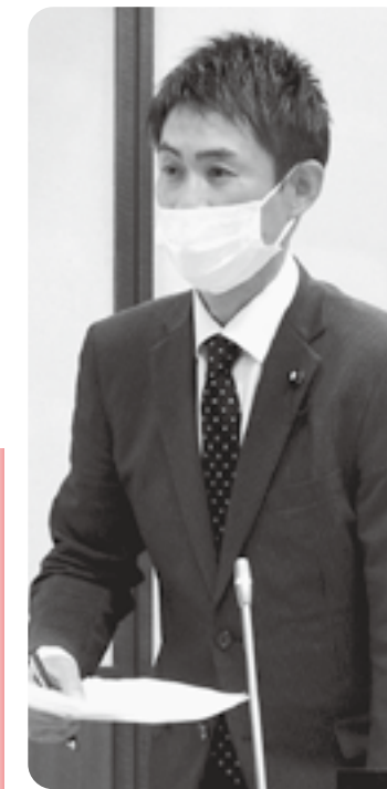
小川 克也 議員

答 実施状況の検証、公募で競争原理が働き、指定管理者には緊張感を持った管理運営が望まれる。年度ごと、実施状況の検証が必要ではないか。事業報告に対する評価は実施していない。施設運営の改善点など更なる住民サービスの質の向上に努めていきたい。