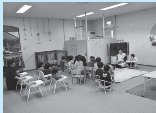
▲認可保育所に移行するチャイルドランドおおひら園