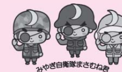
みやぎ自衛隊まさむね

◆問い合わせ先 自衛隊宮城地方協力本部 大崎地域事務所 住所 大崎市古川駅東2-6-10 ☎ 0229-23-1178 Eメール oosaki-miyagi@rct.gsdf.mod.go.jp