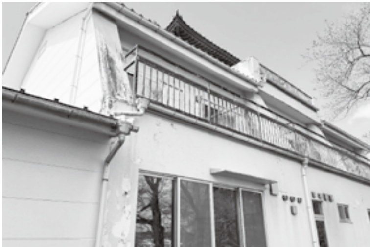
傷みが進んでいる大衡城青少年交流館

教育長 大幅な耐震補強・外壁補修・シロアリ被害等利活用には多額の経費がかかるのでこれまでどおり解体とする。