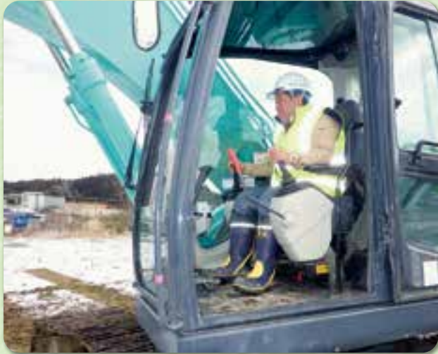
重機の操作は常に慎重に

大衛小学校で全児童が参加した交通安全教室が開かれました。新一年生も左右確認して横断歩道を渡っていました。