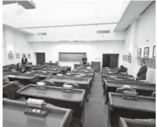
体験型英語研修施設（ブリティッシュヒルズ）