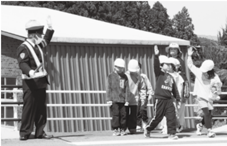
しっかり手をあげて渡りましょう（交通安全指導）