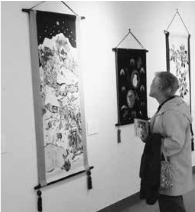
布絵展（ふるさと美術館）

答 保育施設を利用せずに家庭で6カ月～満3歳までの乳幼児を保育している世帯を対象に月1万円を支給する。