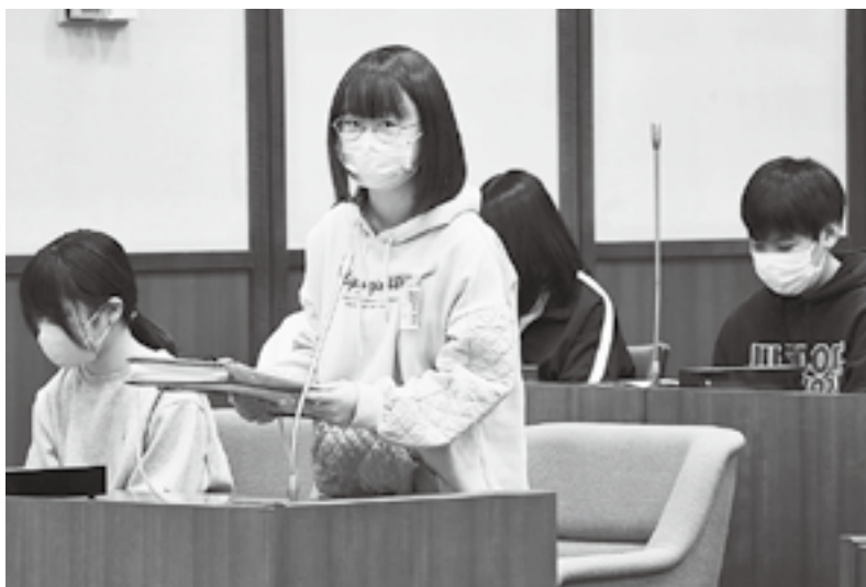
村長さんショッピングモールがあったらいいなあ（こども議会）

村長 こども達の要望・意見が一つでも多く叶えられるように、今後の村政運営の参考にしていきたい。