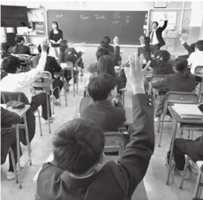
大衡中学校の授業風景

教育長 本村でも増加傾向にあるが、不登校の要因は複雑多様であり、保護者や関係機関と連携し、個々に応じた支援を図っていく。心のケアハウスや別室での学習も行い、誰もが安心して学べる学校生活を考えている。