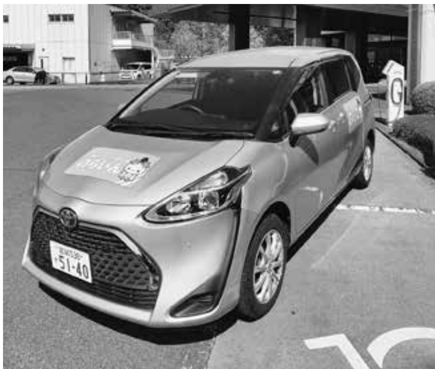
みなさんの足となっている「のらいん」

答 賃金、物価水準の変動などにより、万葉まちづくりセンターから管理料の変更について求められた。関係課と協議して対応していく。