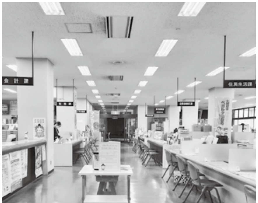
13課体制で新年度がスタート（役場庁舎内）

村長 時差勤務制度の導入やDXによる業務改善などにより、労働時間の短縮に取り組む。「職員の身上調査」を行ない職務の適性を考慮し、配置換えなどで風通しの良い職場づくりに努めていく。