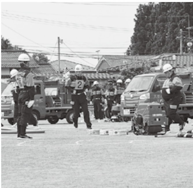
有事への備えを万全に（消防操法訓練）

村長 村で調整した訓練以外に分団独自に訓練をした旨申し出があった場合には、訓練手当を支給していきたい。