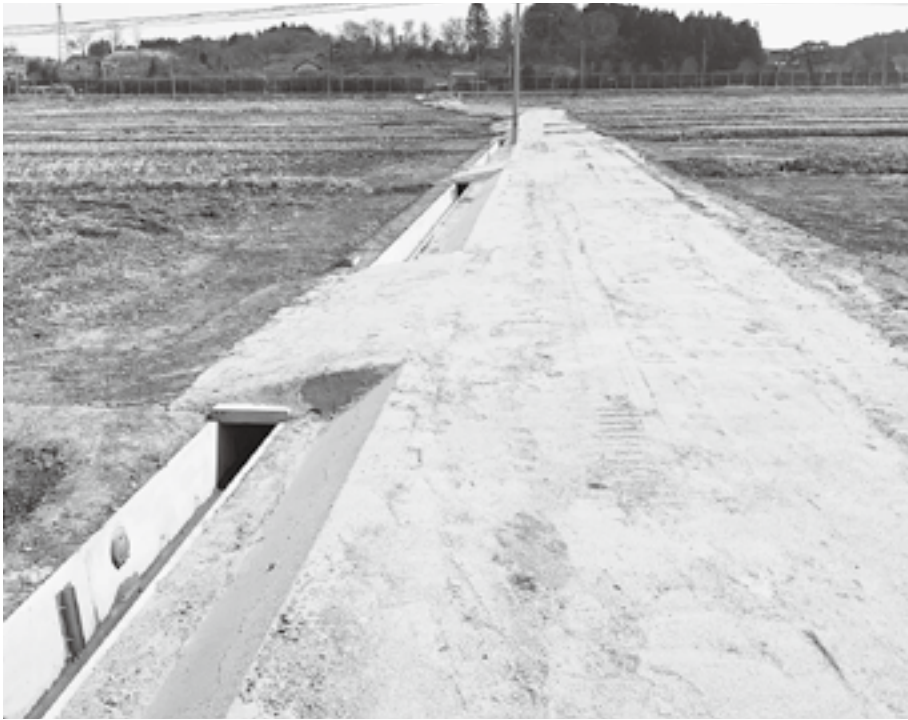
整備中の針東用排水路（衡上地区）