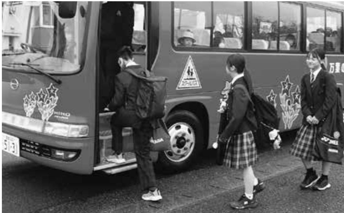
毎日の登下校を支えるスクールバス