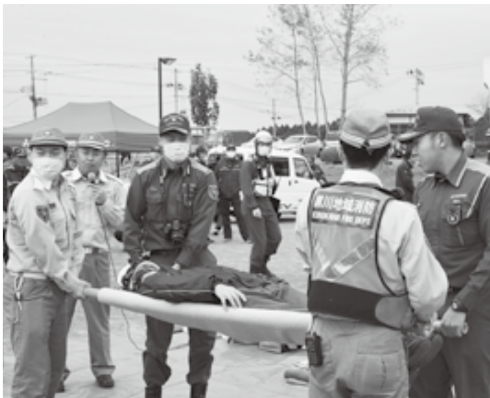
大切な命を守るために（防災訓練）

副村長 危機管理体制で大事なことは日頃の訓練である。地震、林野火災を含め、体で覚え身に付けるため可能な限り訓練をしていきたい。