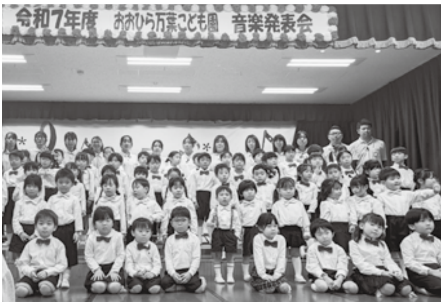
未来を担う子どものために（おおひら万葉こども園）

村長 防衛交付金は医療費助成や学校給食費、デマンド型交通にも一部財源としている。企業版ふるさと納税も各企業に働きかけており、村の大切な子どもたちのために財源ができる時期に取り組んでいきたい。