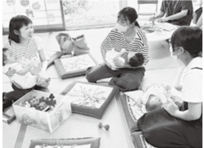
情報交換するお母さん