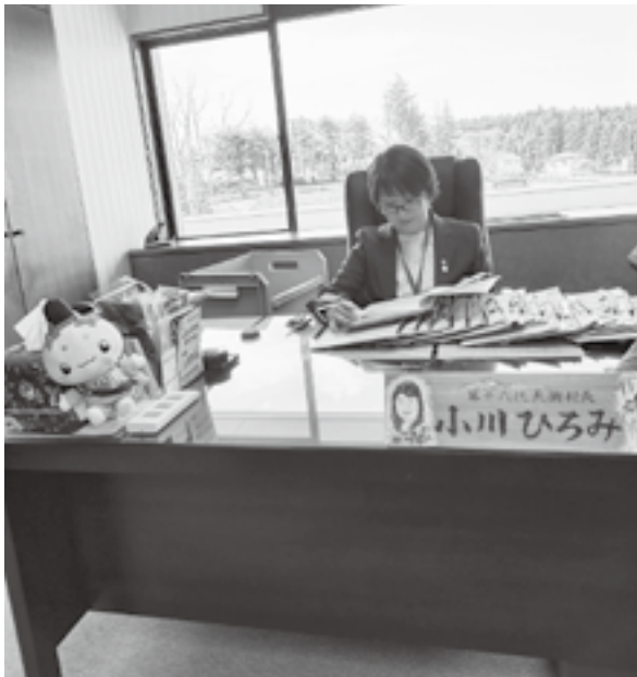
執務中の小川村長

村長 目的が達成されたものの、長年活用のないものや基金額が少額で運用益が見込めないものは、廃止や整理統合してきた。引き続き見直しを行い、基金の有効活用と効果的な運用に努めていく。