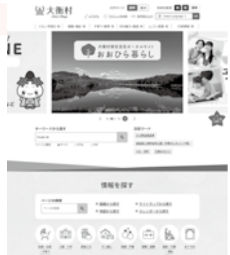
リニューアルした村ホームページ

これまでのウェブサイトは、探しにくさや円滑に利用できないといった弱さがあった。リニューアルにより、住民が必要情報へ迅速に到達でき、随時情報も発信できる環境づくりに努められたい。