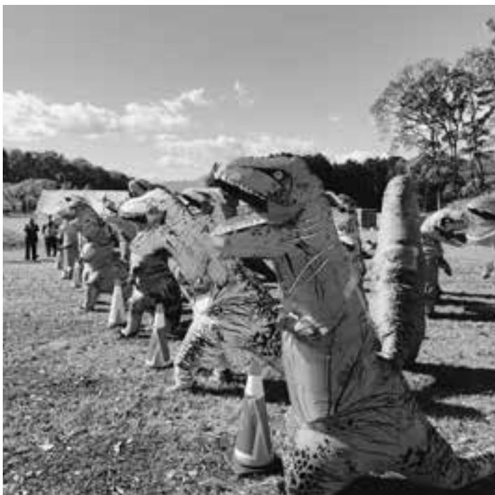
キャンプ場で開催されたティラノサウルスレース