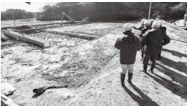
整備中の排水処理施設